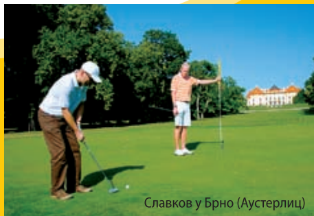
Славков у Брно (Аустерлиц)