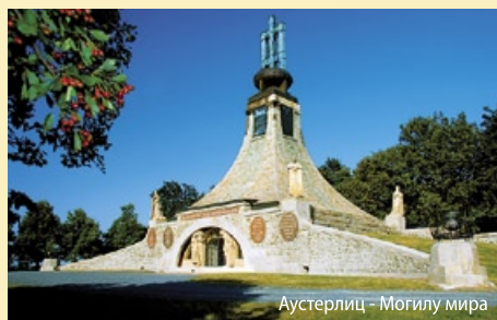
Аустерлиц – Могила мира